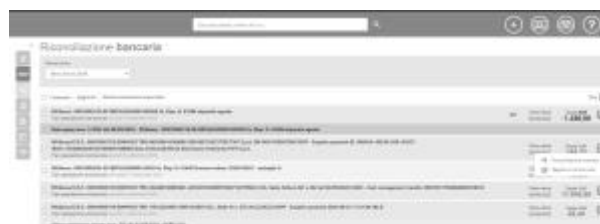
3 - Riconciliazione manuale