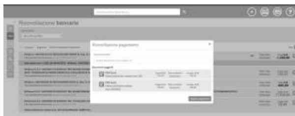
4 - Documenti proposti per riconciliazione manuale