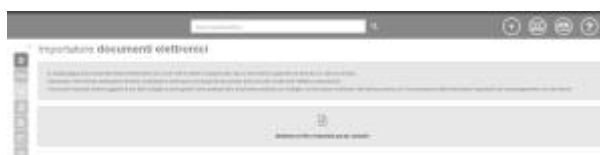
6 - Importa documento elettronico

Una volta completata l'importazione con successo, la procedura di riconciliazione è analoga a quella descritta sopra.