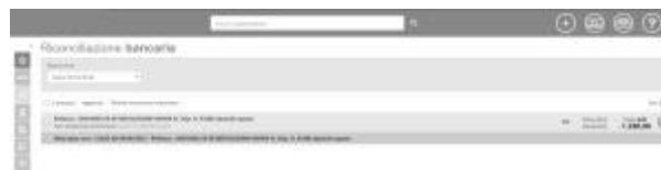
1 - L'icona verde segnala una voce dell'estratto conto già riconciliata con un documento sul gestionale

Una riconciliazione confermata può essere sempre annullata selezionando l'opzione Annulla riconciliazione dal menu contestuale della voce dell'estratto conto.