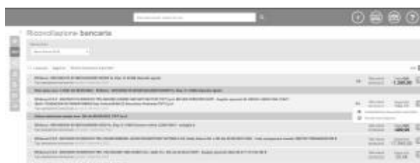
5 - Annullamento riconciliazione

Solo per le operazioni di riconciliazione è anche possibile importare l'estratto conto come file esportato manualmente dall'utente dal suo home banking.