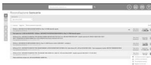
2 - Riconciliazione automatica